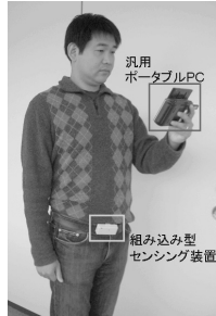
図 3 ユーザが装着した外観