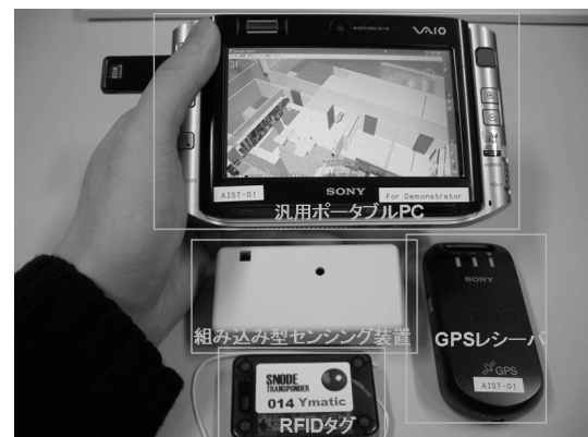
図1 本システム一式の外観

組み込み型センシング装置は利用者の腰部に装着され、加速度、角速度、磁気（各3軸）を観測してそれらのセンサデータを無線送信する機能を備える。汎用ポータブルPC上では、受信したセンサデータを処理して、位置・方位を推定するソフトウェアが動作している。このソフトウェアの出力に基づいて、Google Earthによって周辺の建物や構造物などのテクスチャ付き3次元モデルと共にユーザの現在位置・方位が可視化される。この画面によってナビゲーション機能を実現する。本シ